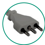
Type L - 16A