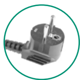
Type F - Schuko